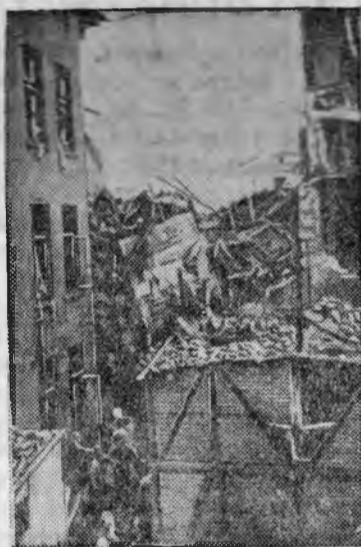
Разрушения в одном из германских городов, причиненные бомбардировкой английской авиации.